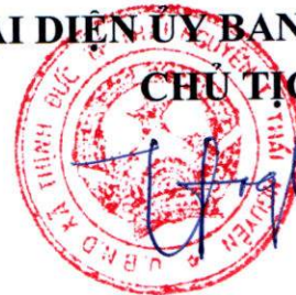
Lê Thanh Long