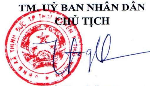
Lê Thanh Long